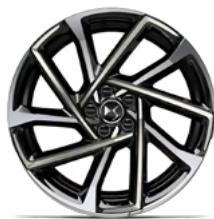
Zliatinové disky 19" VERSAILLES (v sérii pre Rivoli+)