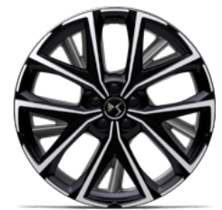
Zliatinové disky 20" MUNICH (v sérii pre Rivoli+ E-TENSE 4x4 360K)