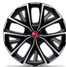
Zliatinové disky 20" MUNICH (v sérii pre Performance Line+ E-TENSE 4x4 360K)