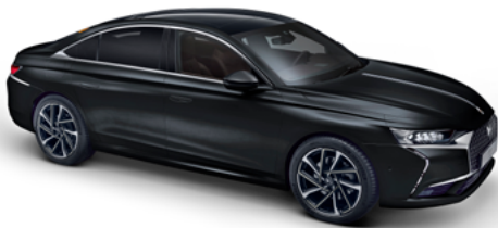
Čierna PERLA NERA (P)