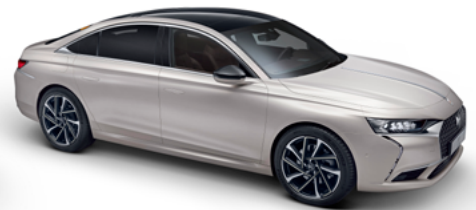
Sivá CRYSTAL PEARL (P)