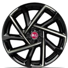
Zliatinové disky 19" MONACO (v sérii pre Performance Line+)